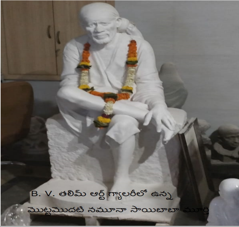
B. V. తలిమ్ ఆర్ట్ గ్యాలరీలో ఉన్న మొట్టమొదటి నమూనా సాయిబాబా మూర్తి