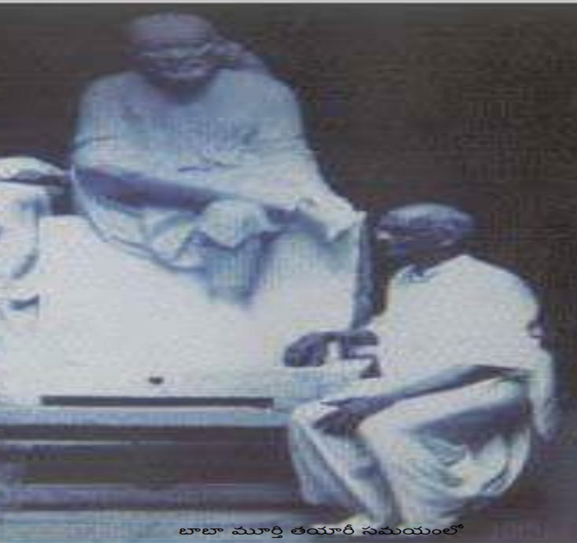
బాబా మూర్తి తయారీ సమయంలో